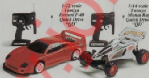
1:12 scale Tamiya Ferrari F-40 Quick Drive "QD"

Clod Buster is the first ready-to-run that really runs. So look for it at a hobby shop near you. Then take five minutes and take the ride of your life. The next scream you hear will be your own.