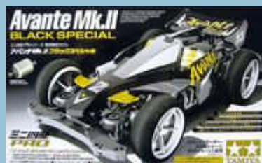
Avante MkII Black Special