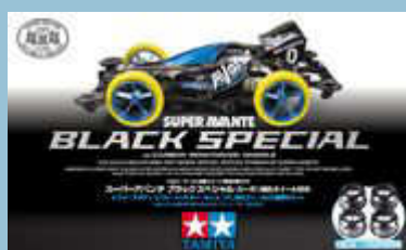
Super Avante Black Special (con ruote in carbonio).