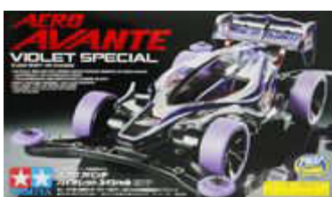
Aero Avante Violet Special