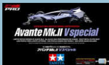
Avante MkII V Special