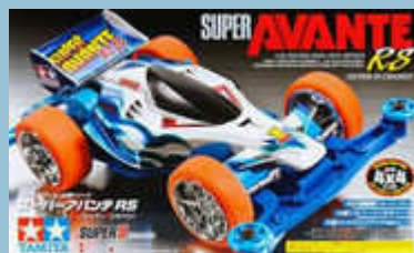
Super Avante RS