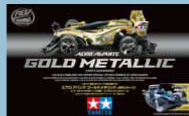
Aero Avante Gold Metallic