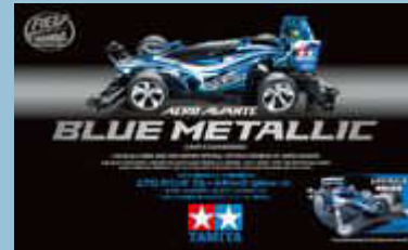
Aero Avante Blue Metallic