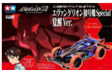
Avante Mk.III Azure Eva-01 Special - Versione risveglio -