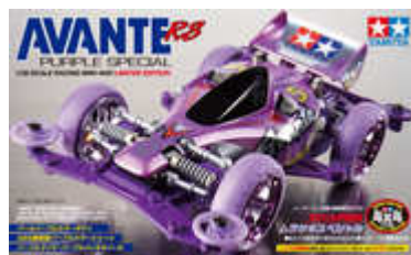
Avante RS Purple Special