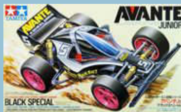
Avante Jr. Black Special