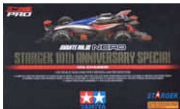
Avante Nero Stargek 10th Anniversary Special