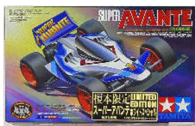
Super Avante RS Enomoto Special