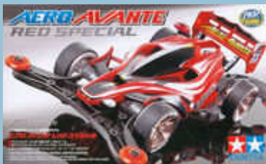
Aero Avante Red Special