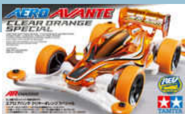
Aero Avante Clear Orange Special