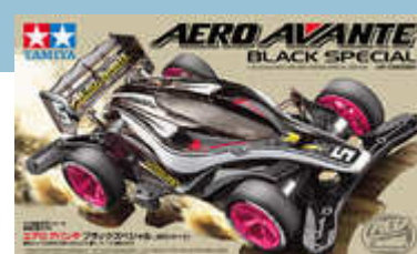
Aero Avante Black Special