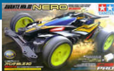
Avante Mk.III Nero