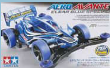
Aero Avante Clear Blue Special