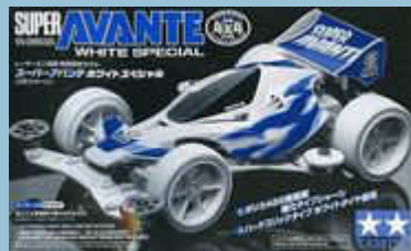
Super Avante White Special