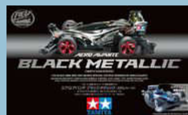
Aero Avante Black Metallic