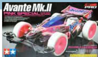
Avante MkII Pink Special