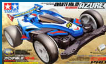
Avante Mk.III Azure