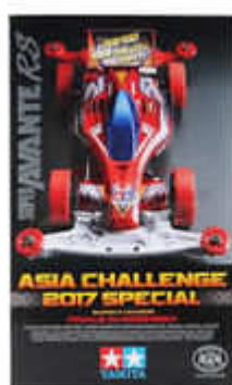
Super Avante RS Asia Challenge 2017 Special