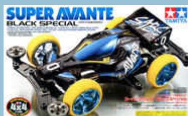
Super Avante Black Special.