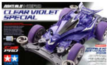
Avante Nero Clear Violet Special