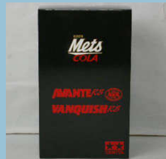
Avante Jr Kirin Mets Cola