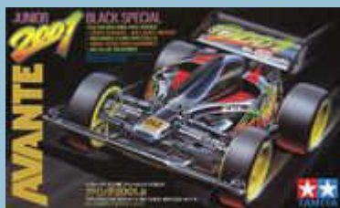
Avante 2001 Jr. Black Special.